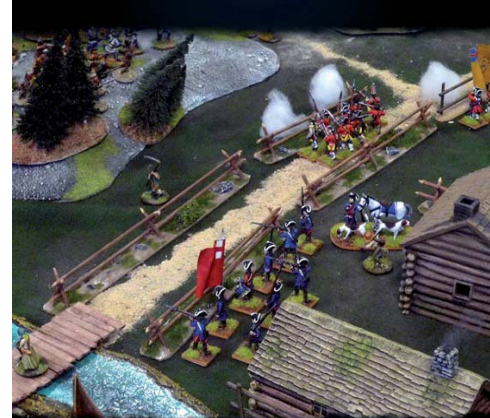
24 et 25 Avril 2010 Rencontre de jeux et stratégie avec historiques et fantastiques organisé par l'A.J.H.A